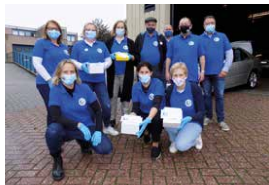
▲ Onze senioren werden in oktober verrast met een lekkere attentie.

Ook de bewoners van het verzorgingstehuis Hof ter Dennen en Huize De Berken werden niet vergeten. Zij mochten smullen van een lekkere appelcake.