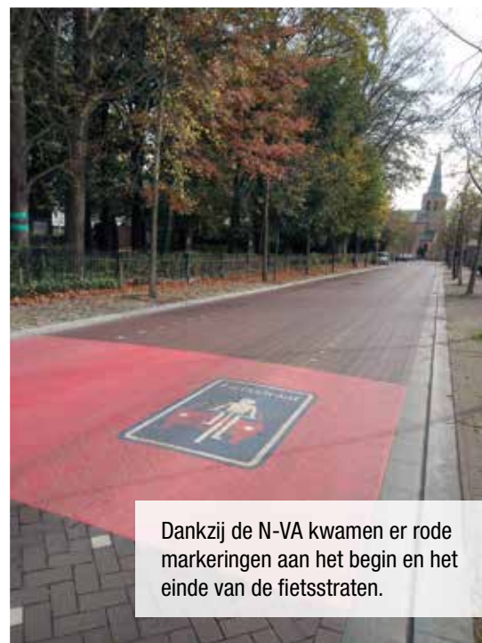
Dankzij de N-VA kwamen er rode markeringen aan het begin en het einde van de fietsstraten.