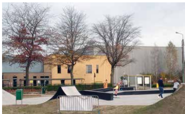
Op 4 november werd het lang verwachte skatepark ingehuldigd. Dat is helaas het enige lichtpuntje in de grote onzekerheid over het Diepvenneke.

De gemeente kocht inmiddels een deel van de gronden tegenover sporthal het Diepvenneke aan. Maar er is geen doordacht plan. De N-VA heeft al meermaals gevraagd om een masterplan op te stellen met daarin een situering van de verschillende verenigingen, de budgetten en de fasering. Maar dat vond cd&v niet nodig.